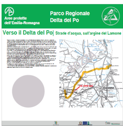
Pannello LATO 'A'