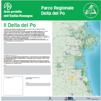
Pannello LATO 'B'