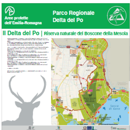
Pannello LATO "A"

OPERAZIONE: 19.3.2 - COOPERAZIONE INTERTERRITORIALE Progetto COOPERAZIONE LEADER: "CAMMINI" - PERCORRENDO LE VIE DI PELLEGRINAGGIO DAGLI APPENNINI AL DELTA DEL PO – ITINERARI NELLE AREE RURALI DELL'EMILIA-ROMAGNA AZIONE LOCALE L.2: Allestimento e valorizzazione dei percorsi lungo i cammini Allegato E - Fac-simile cartellonistica informativa da realizzarsi sulla base del "Manuale di immagine coordinata nei comuni area Leader" definita da parte dell'Ente per la gestione dei parchi e delle aree protette – Delta del Po e scaricabile al seguente link: https://www.deltaduemila.net/sito/wp-content/uploads/2021/03/Cartellonistica-Coordinata-Leader.pdf