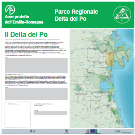
Pannello LATO "B"